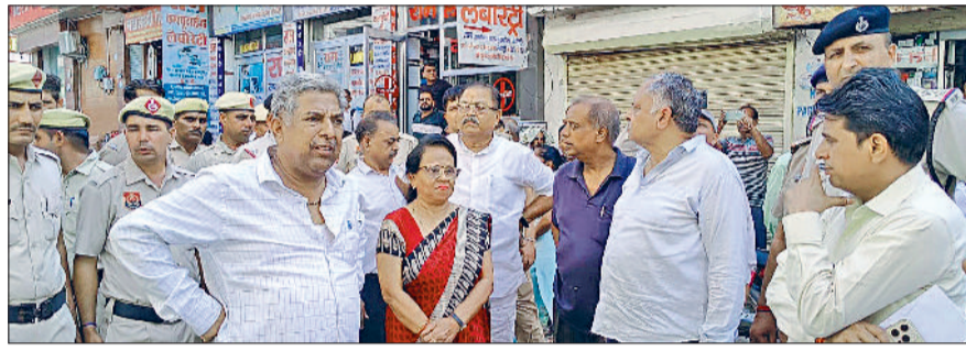
नरवाना। स्कूल की समिति को चार्ज दिलवाने के लिए स्कूल के बाहर मौजूद एसडीएम व अन्य।

समितियों के लिए नामांकन पत्रों की जांच के बाद सभी समितियों का निर्दिष्ट चुनाव संपन्न करवा था हरिभूमि न्यूज नरवाना