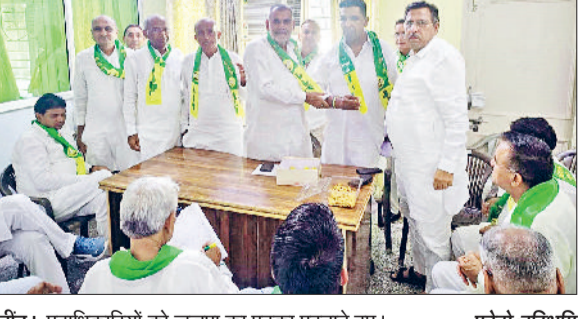
जीद। पदाधिकारियों को जजपा का पटका पहनाने हुए।

कटाव से बचाते हैं और वायु को स्वच्छ करते हैं। प्रदूषण की समस्या को कम करने में भी वृक्ष अहम भूमिका निभाते हैं। कहा कि यदि हम चाहते हैं कि आने वाली पीढ़ियां स्वस्थ और खुशहाल जीवन जी सकें, तो हमें अभी से पेड़-पौधे लगाने होंगे और उनकी सुरक्षा करने का संकल्प लेना होगा।