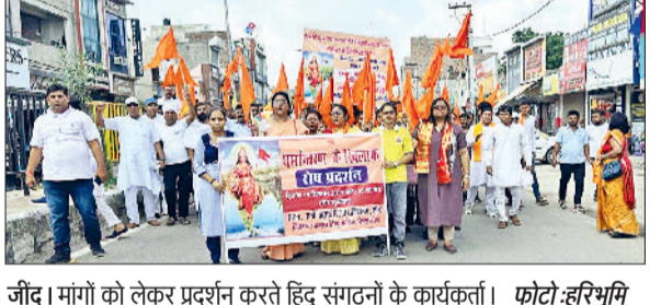
जीद। मांगों को लेकर प्रदर्शन करते हिंदू संगठनों के कार्यकर्ता।