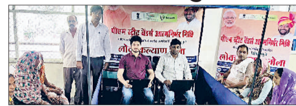
जींद। जानकारी देने के लिए बैठे कर्मी।