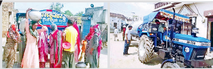
जींद। बधाना गांव में पीने के पानी के लिए विभाग द्वारा भेजे टैंकर से पानी लेने के लिए महिलाओं की लगी भीड़ तथा बधाना गांव में विभाग द्वारा पीने के पानी की उपलब्धता को लेकर भेजा टैंकर।

गांव के लोगों का कहना है कि विभाग द्वारा जलघर में नहरी पानी के लिए लाखों रुपये खर्च कर मोटर आदि तो रखवा दी लेकिन विभाग गांव में नहरी पानी की आपूर्ति बहाल नहीं कर पाया है। हालांकि गांव के जलघर में नहरी पानी के टैंक फुल हैं, लेकिन फिर भी गांव के लोगों को नहरी पानी की सप्लाई नहीं दी जा रही है। गांव के लोगों का कहना है कि जलघर में नहरी पानी की सप्लाई के लिए रखी मोटरों में ही विभाग घाबला कर रहा है। विभाग ने जब गांव में नहरी पानी की सप्लाई के लिए जलघर में मोटर रख दी तो फिर इन मोटरों को चलाया क्यों नहीं जा रहा है। ऐसे में विभाग की कार्यपालनी स्टेज के घेरे में गिरती नजर आ रही है। विभाग की मासूमि के चक्रे गांव के लोगों को खसखसालत का पानी तो दूर की बात, नहरी पानी भी उपलब्ध नहीं हो रहा है। गांव के लोगों ने जलघर में विभाग द्वारा लाखों रुपये खर्च कर नहरी पानी के लिए लगाई मोटर ममले में जांच करने की मांग की है ताकि लोगों को नहरी पानी मिल सके।