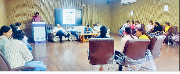
कैथल। प्रतिभा खोज कार्यक्रम में भाग लेते विद्यार्थी।