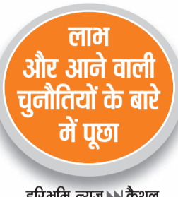
हरिभूमि न्यूज़ कैथल

किसानों को किया फसल अवशेष प्रबंधन एवं फसल विविधीकरण के प्रति प्रेरित